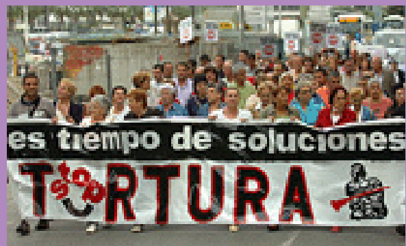
Manifestación celebrada en Santurtzi el pasado 26 de Junio (Día de apoyo a las víctimas de tortura).

La apuesta represiva continua por parte de los estados español y francés.