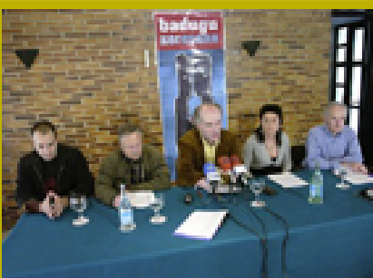
Rueda de prensa.

T orturaren Aurkako Taldearen ekimenez 53 lagunek manifestua egin dute eta, haien ustez, "ETAren biktimak bakarrik gogoan edukita eta Frantziako eta Espainiako estatuen biktimak baztertuta" egingo da ekitaldia. Igandean izango da, Bilbon, Euskalduna Jauregian. "Biktima denek merezi dute ezagutza eta errespetua".