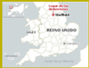
Sheffield, al norte de Inglaterra, lugar de las 3 detenciones.