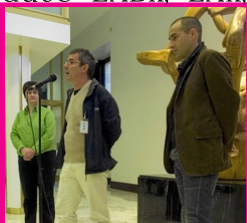
Miembros de TAT en el Parlamento vasco.

Donostian atxilotutako gazteak espetxean inkomunikatu izana ez dute ontzat jo alderdi gehienek.