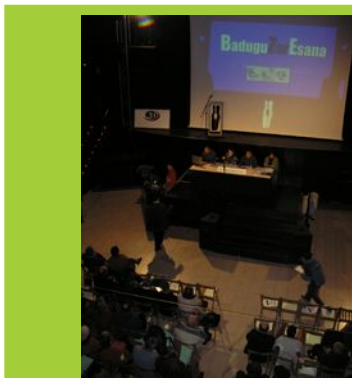
II Asamblea nacional de torturados/as.

TAT: «Inoiz baino indartsuago gaude eta indartsuago izango gara».