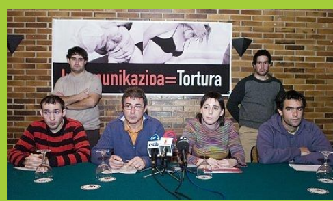
Rueda de prensa de TAT.

Inkomunikazioaren amaiera da TATen ustez, torturaren aurkako gakoa.